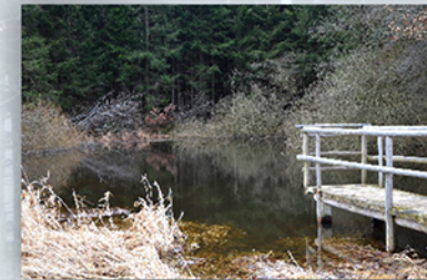
14 Die Sage vom Buchmännle