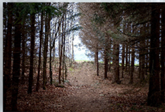
9 Die Sage vom Alten Schweden