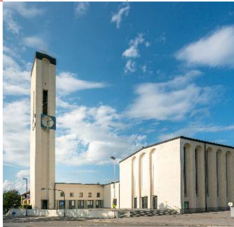
Chiesa dello Spirito Santo Cuore di Gesù a Neugablonz

Copertina: XI Foto Langer Edizione: 1.06.2021 / 2 XI Foto Langer, Erwin Keller, Verbielotografie Weiss GmbH Kaufbeuren Tourismus- und Stadtmarketing e.V., Ingrid Küsel, Peter Ernst, Museo dei vigili del fuoco KF-OAL, Roland Hank, Convento di Santa Crescenza, Die Fotografin Malena Gotschke, Fotografe: Alexander Bernhardt, Zoëy Braun/Stadtmuseum Kaufbeuren, Stempa: Buch- und Offsetdruck Lauerwald, Inh. Andreas Pröber Traduzione: Giuseppina Circa Scivo Testi: Charlotte Brandel, Jan T. Wilms, Stadtmuseum Kaufbeuren, Planino dello città desig: Grafikwerk Ulrich Peter Design: Ingrid Küsel, Kaufbeuren Pubblicato da: Kaufbeuren Tourismus- und Stadtmarketing e.V.